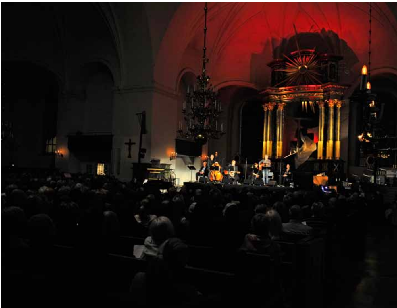
Levande ljus bidrog till stämningen i Katarina kyrka.