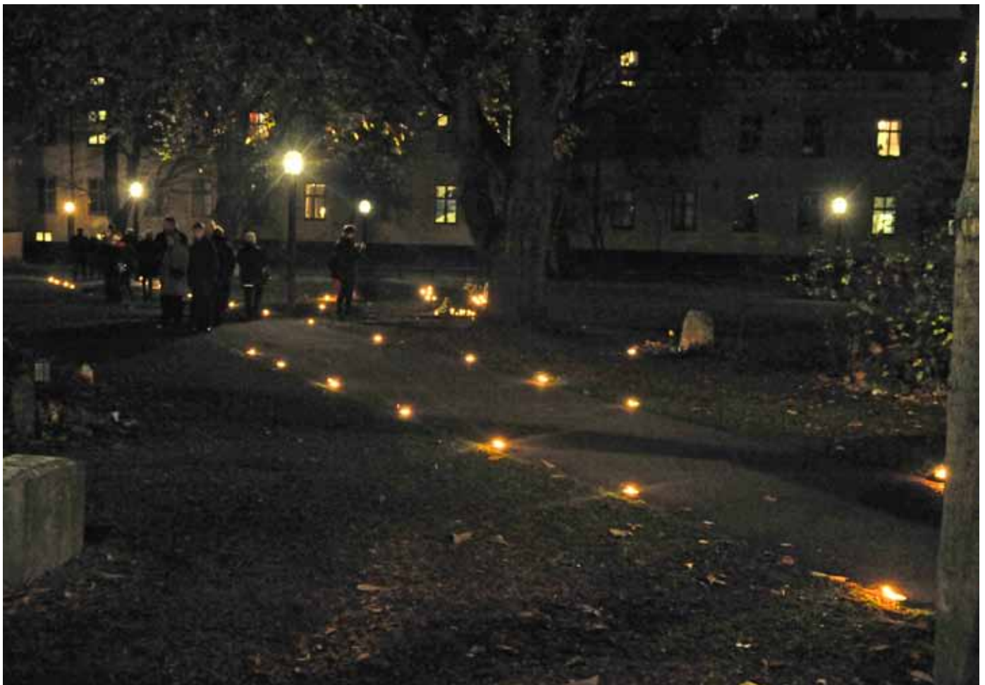
"Skymningen förstärkte och förskönade de många flämtande lågorna utanför katedralen."